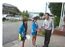
多くの方々から奉納していただ