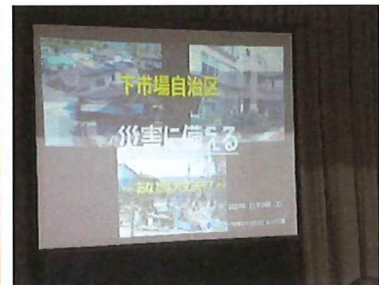
区長から自治区の防災について