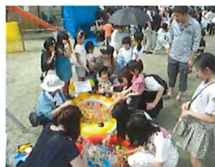
子供会によるイベントで、盛り上がりました