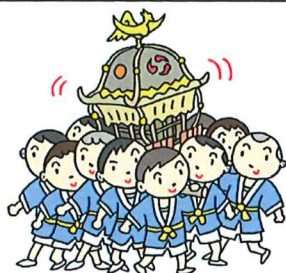
厳かに神事が執り行われました。

10月5日(土)素晴らしい秋晴れの下、無事に「鹿嶋神社大祭」が開催され、玉串奉奠や囃子奉納など氏神様に日頃の感謝と豊作を祈願し厳粛な神事が執り行われました。子ども会によるお神輿の練り歩き、出店も行われました。