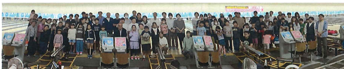
参加者の皆さんの集合写真